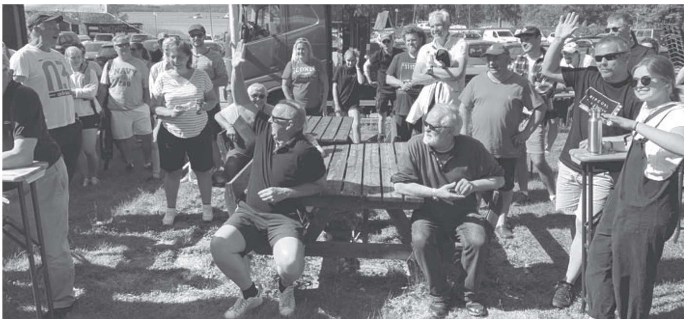
Vid Muskö runt

Efter 15 maj övergår arrendet av marken vid övre planen till Östnora Camping som då kommer att ta ut "husvagnsavgift" per dygn.